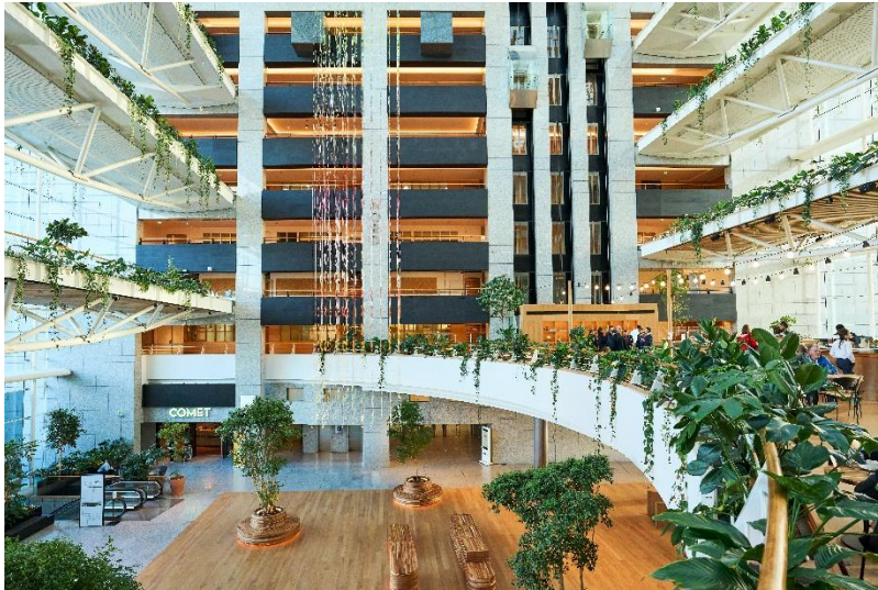
Vue du 1 er étage sur le hall