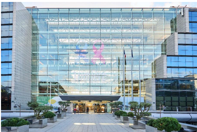
Entrée de l'immeuble