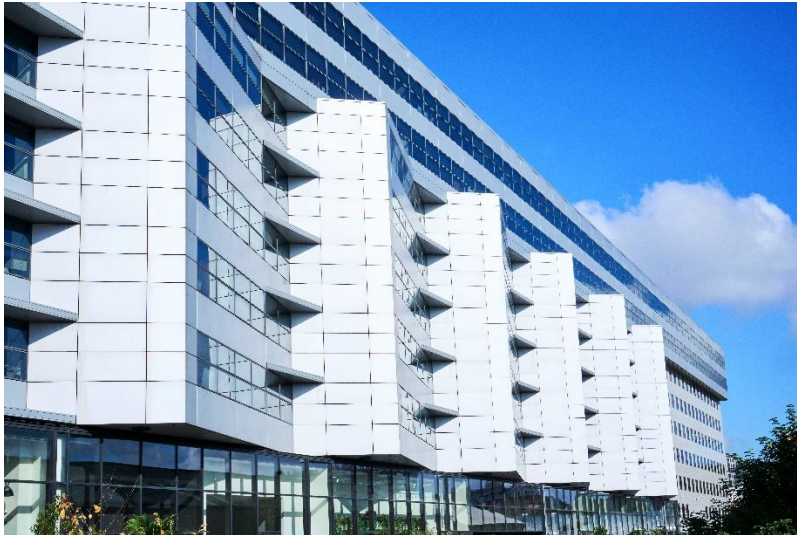
Façade de l'immeuble