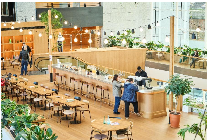
Café Kawaa, lieu de rencontres et de partage